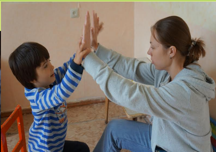
Прикладной анализ поведения (АВА)