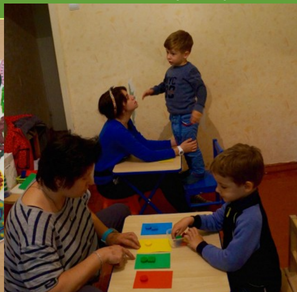
Развитие когнитивных функций