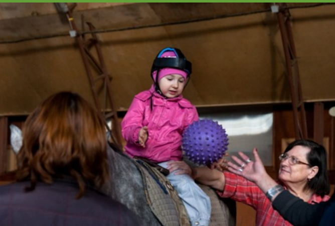
Иппотерапия и Лечебная Верховая Езда (ЛВЕ)