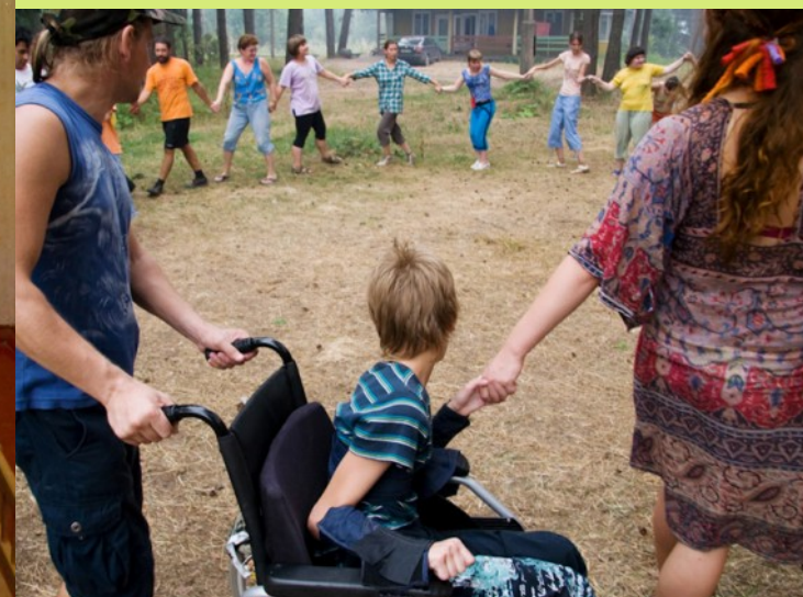
Фольклорные и развивающие игровые группы