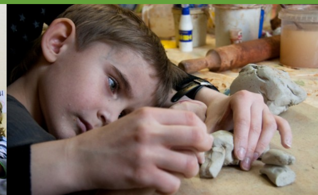
Арт терапия и продуктивная деятельность