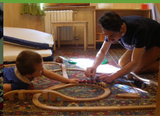
Игровое взаимодействие (FLOORTIME)